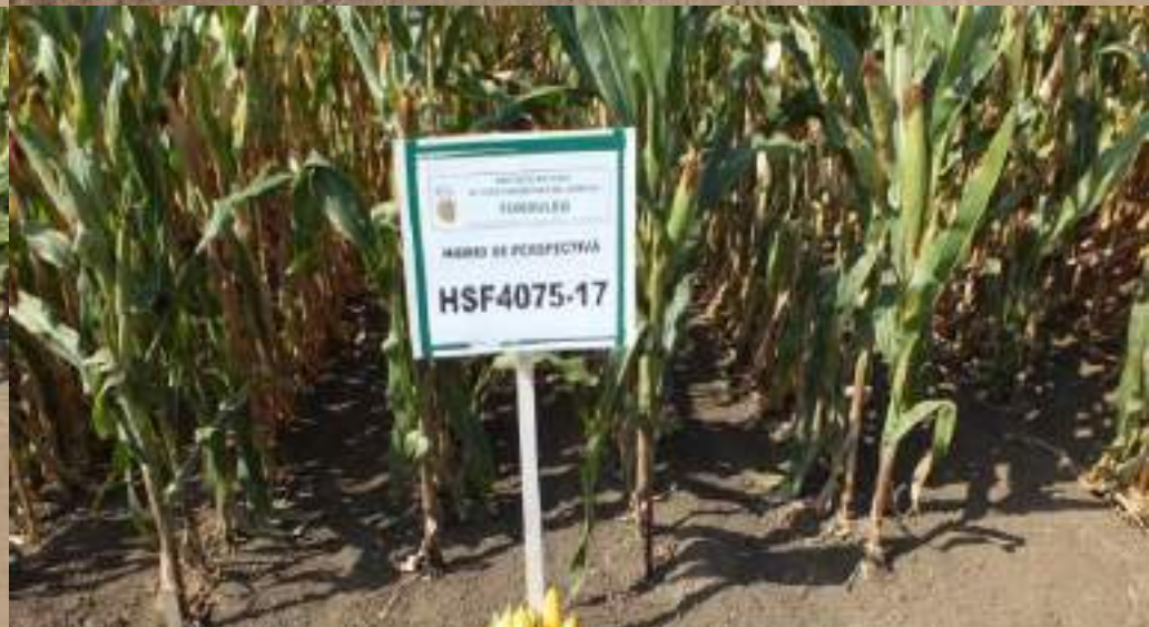
Imagini din câmp- lotul demonstrativ de porumb, întâlnirea cu fermierii