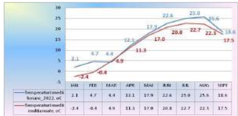
Fig. 2. Temperaturile medii lunare (°C) ale aerului, înregistrate în perioada ianuarie-septembrie 2022, la INCDA Fundulea