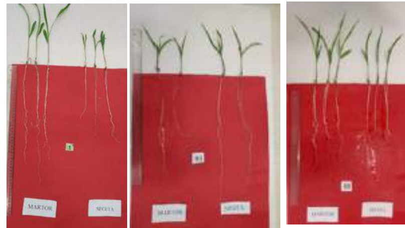
Foto.1. Aspecte din timpul testării la secetă și arșiță