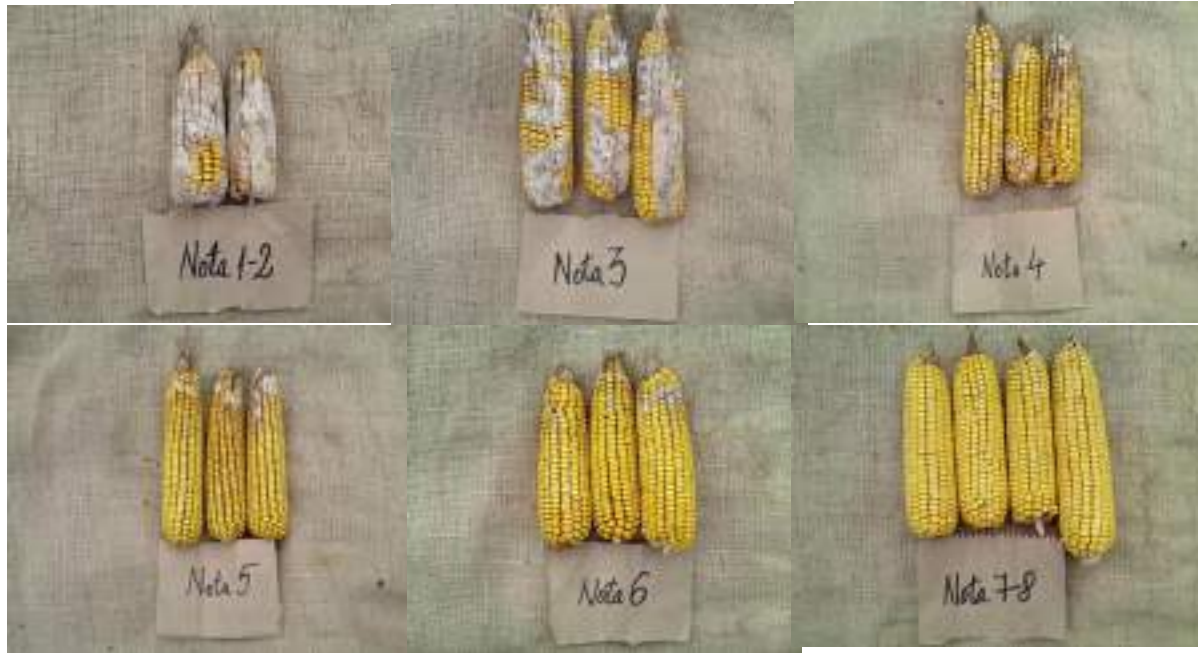
Foto.2.Scara de notare a atacului de Fusarium