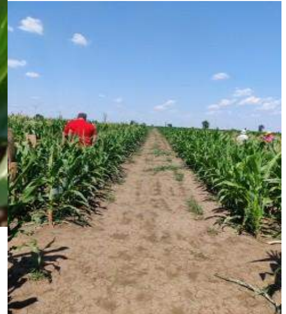
Imagini din câmpul de înmulțire a liniilor consangvinizate