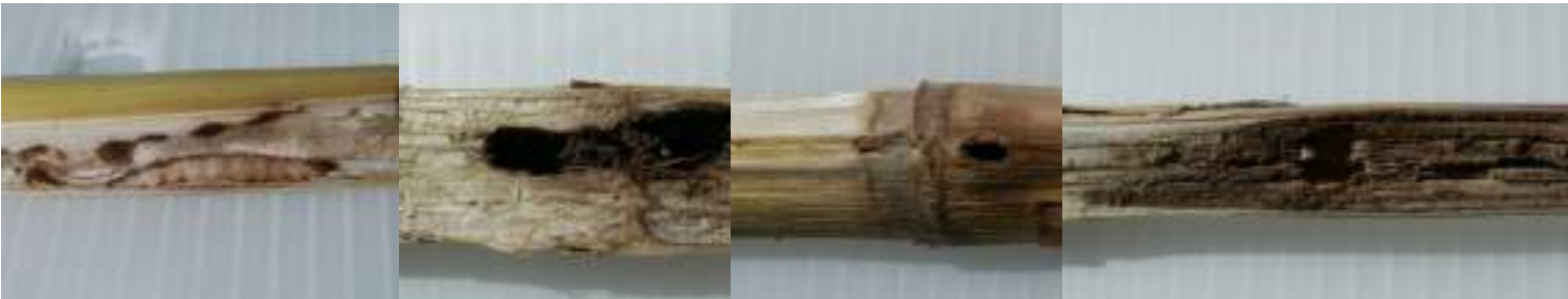
Foto 5. Galerii, larve și exuvii de O. nubilalis în tulpini secționate