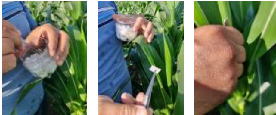
Foto 4. Ponte de O. nubilalis și infestarea artificială a plantelor de porumb(14.06.2022).