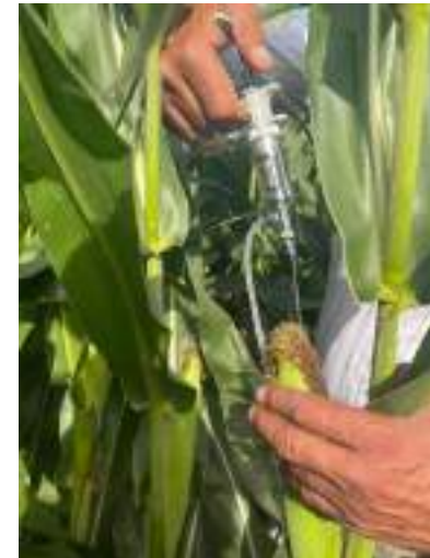
Foto.1. Seringa cu care se injectează știuletele cu inocul și modul de inoculare_iulie 2022