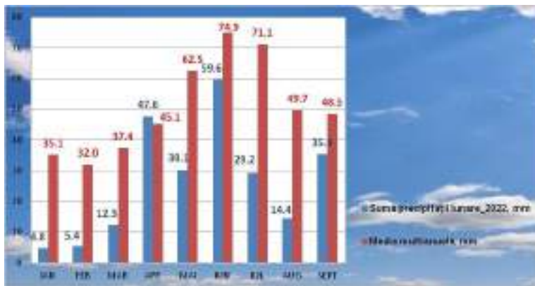
Fig. 1. Precipitațiile (mm) înregistrate în perioada ianuarie-septembrie, 2022 la INCDA Fundulea

Fenomenele severe de secetă și arșiță manifestate în acest an pe toată perioada de vegetație a porumbului, au avut repercusiuni grave asupra dezvoltării și creșterii plantelor și au determinat o scădere semnificativă a producțiilor.