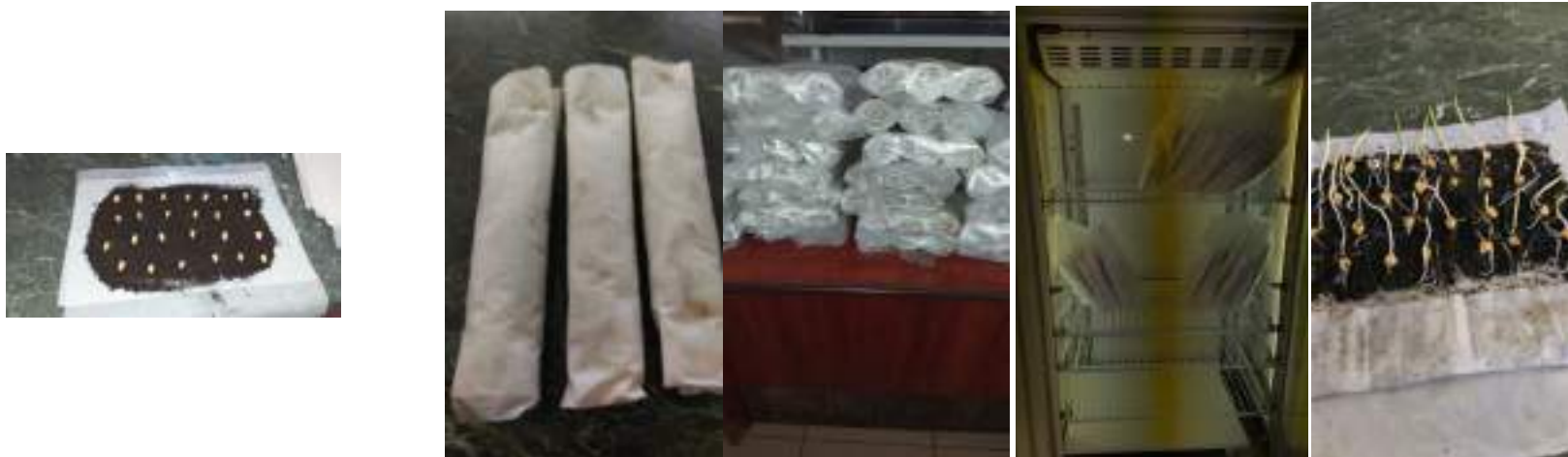
Foto. 2. Germinarea boabelor pe strat de pământ cu nisip, în rulouri de hârtie de filtru