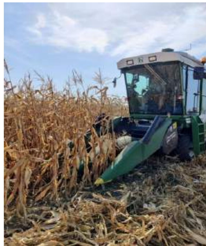
Imagini de la recoltatul culturilor comparative, INCDA Fundulea_20.09.2022