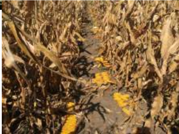
Imagini din PO cu linii consangvinizate_2022