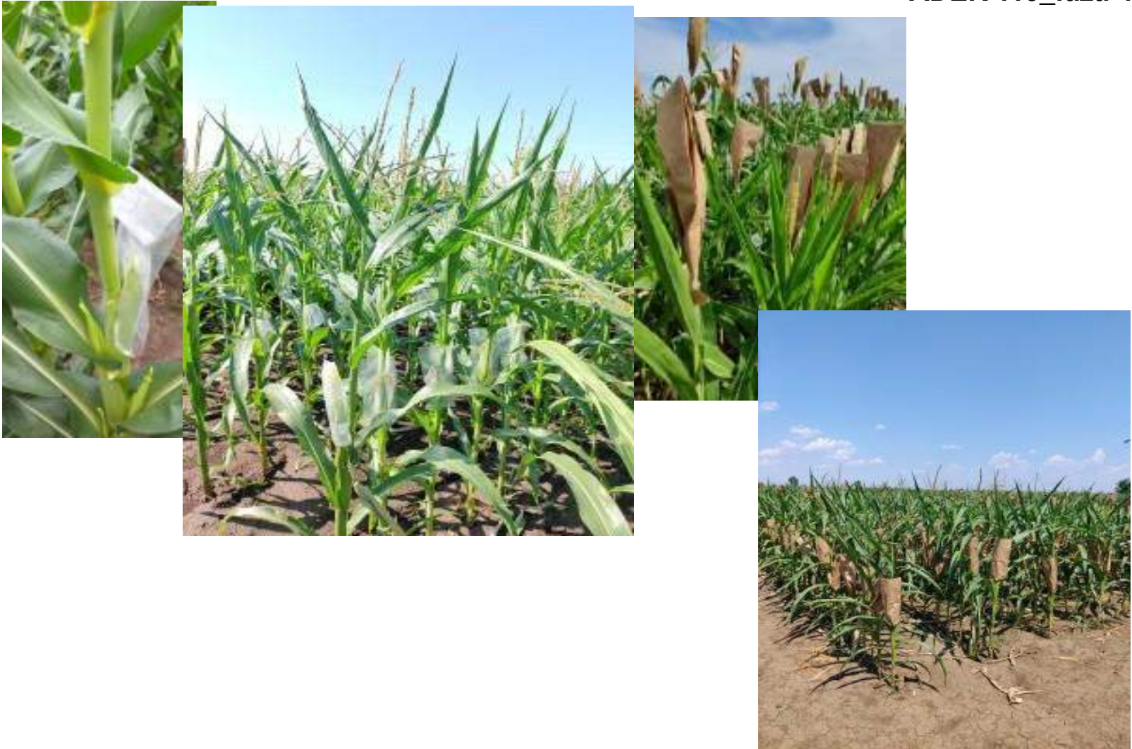
Imagini din câmpul de ameliorare-plante de porumb izolate la pănușă și la panicul