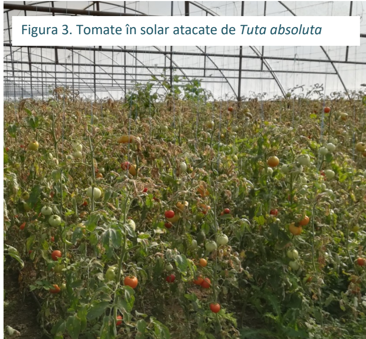
Figura 3. Tomate în solar atacate de Tuta absoluta

Impactul dăunătorului poate fi foarte sever fiind considerat cel mai agresiv dăunător invaziv datorită pierderilor economice în cultura de tomate, care pot ajunge adesea până la 100%. Alte