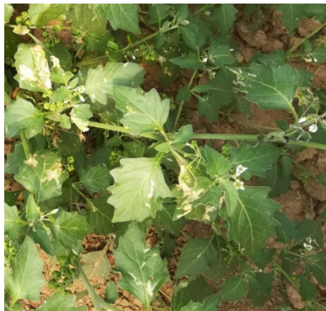
Figura 1. Zârna atacată de Tuta absoluta

Plante gazdă: T. absoluta atacă plante din patru familii botanice: Solanaceae, Amaranthaceae, Asteraceae și Poaceae, acest fapt permițând răspândirea dăunătorului în mai multe habitate în cazul absenței culturilor de tomate (Bayram si colab., 2015).